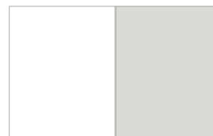
1/1 pagina (full page) B 215 x H 270 mm + 5mm afloop