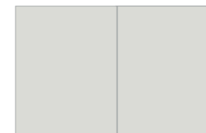
2/1 pagina (spread) B 430 x H 270 mm + 5mm afloop