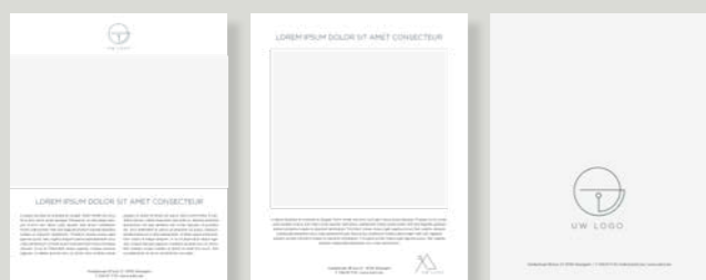
1/1 pagina (full page)

astrix agency: +32 56 61 11 10 | Yannick Dheedene: +32 476 88 89 02 | magazines@astrix.be